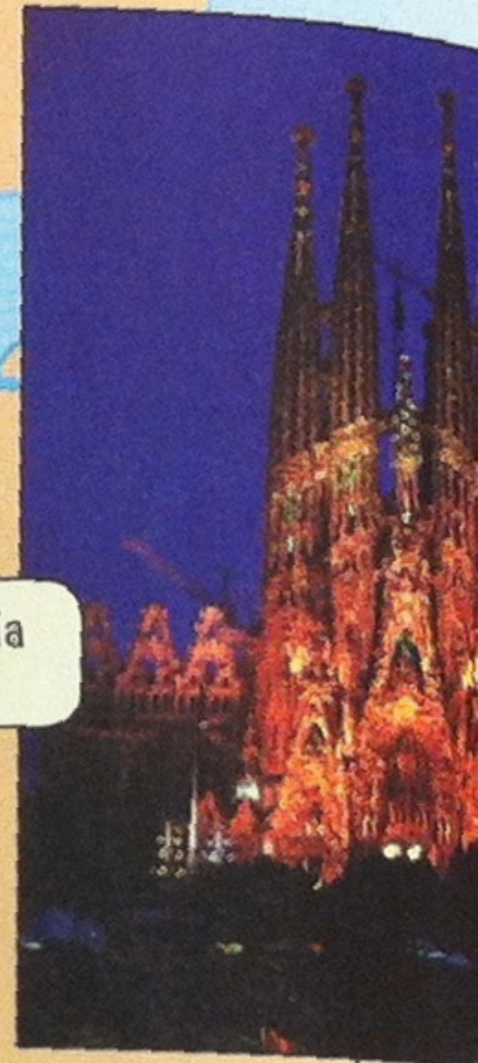
La Sagrada Familia en Barcelona