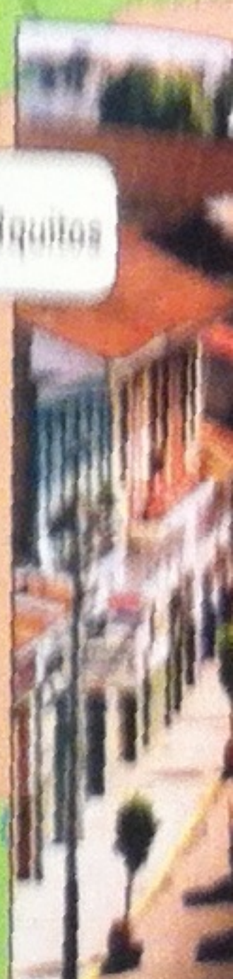
Calle en la ciudad de Iquitos