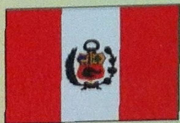
Bandera del Perú