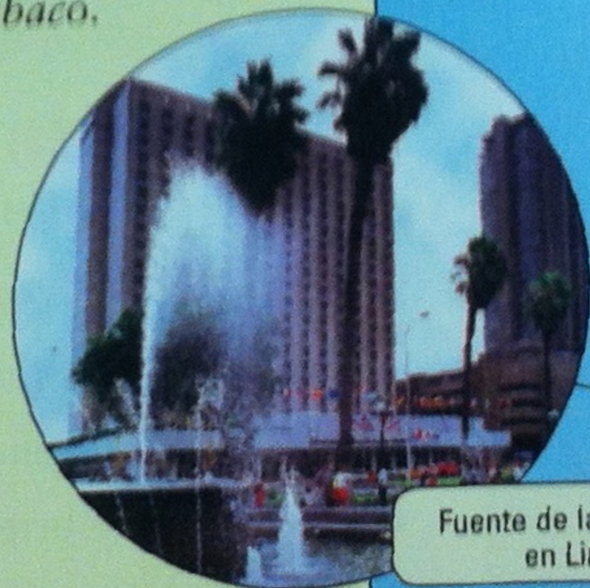
Fuente de la Justicia en Lima