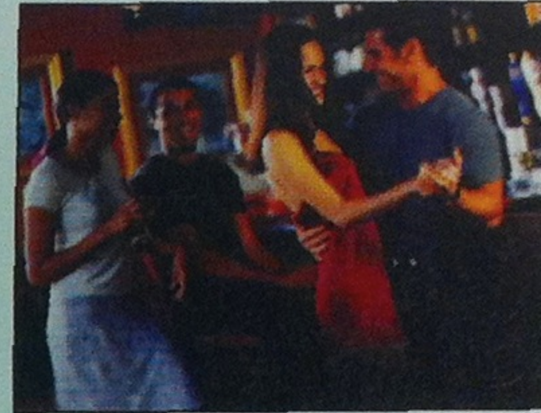
Isla de Culebra

La salsa, este estilo musical de origen puertorriqueño y cubano, nació en el barrio latino de la ciudad de Nueva York. Dos de los músicos de salsa más famosos son Tito Puente y Willie Colón, los dos de Nueva York. Las estrellas de la salsa en Puerto Rico son Felipe Rodríguez y Héctor Lavoe. Hoy en día, Puerto Rico es el centro internacional de la salsa. El Gran Combo de Puerto Rico es una de las orquestas de salsa más famosas del mundo.