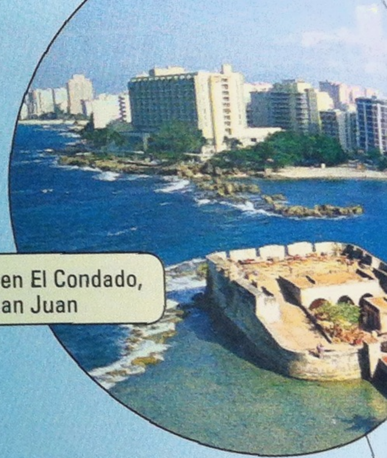
Hoteles en El Condado, San Juan