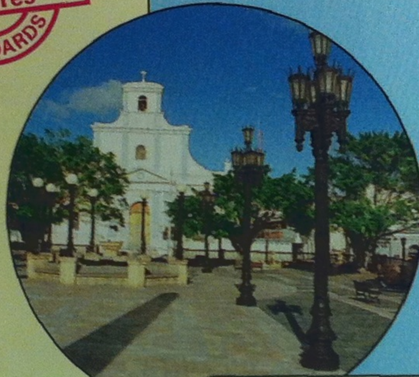
Plaza de Arecibo