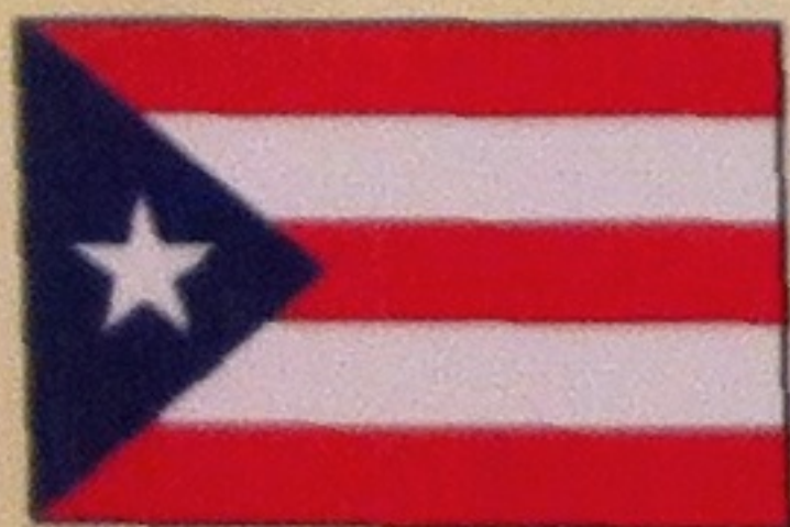
Bandera de Puerto Rico

Aproximadamente la cuarta parte de la población puertorriqueña habla inglés. Pero, en las zonas turísticas este porcentaje es mucho más alto. El uso del inglés es obligatorio para documentos federales.